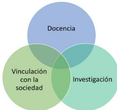
Figura 2. Articulación de los proyectos de vinculación con la sociedad

Las instituciones de educación superior, podrán crear instancias institucionales específicas para gestionar la vinculación con la sociedad, a fin de generar programas, proyectos específicos o intervenciones de interés público (artículo 82).